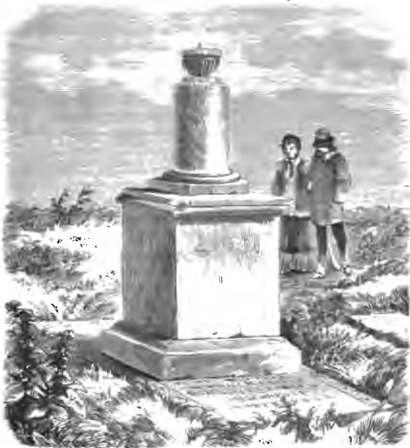
ПАМЯТНИКЪ НА МОГИЛЪ АРТЕМІЯ ПЕТРОВИЧА ВОЛЫНСКАГО. † 27 Юля 1740 г.