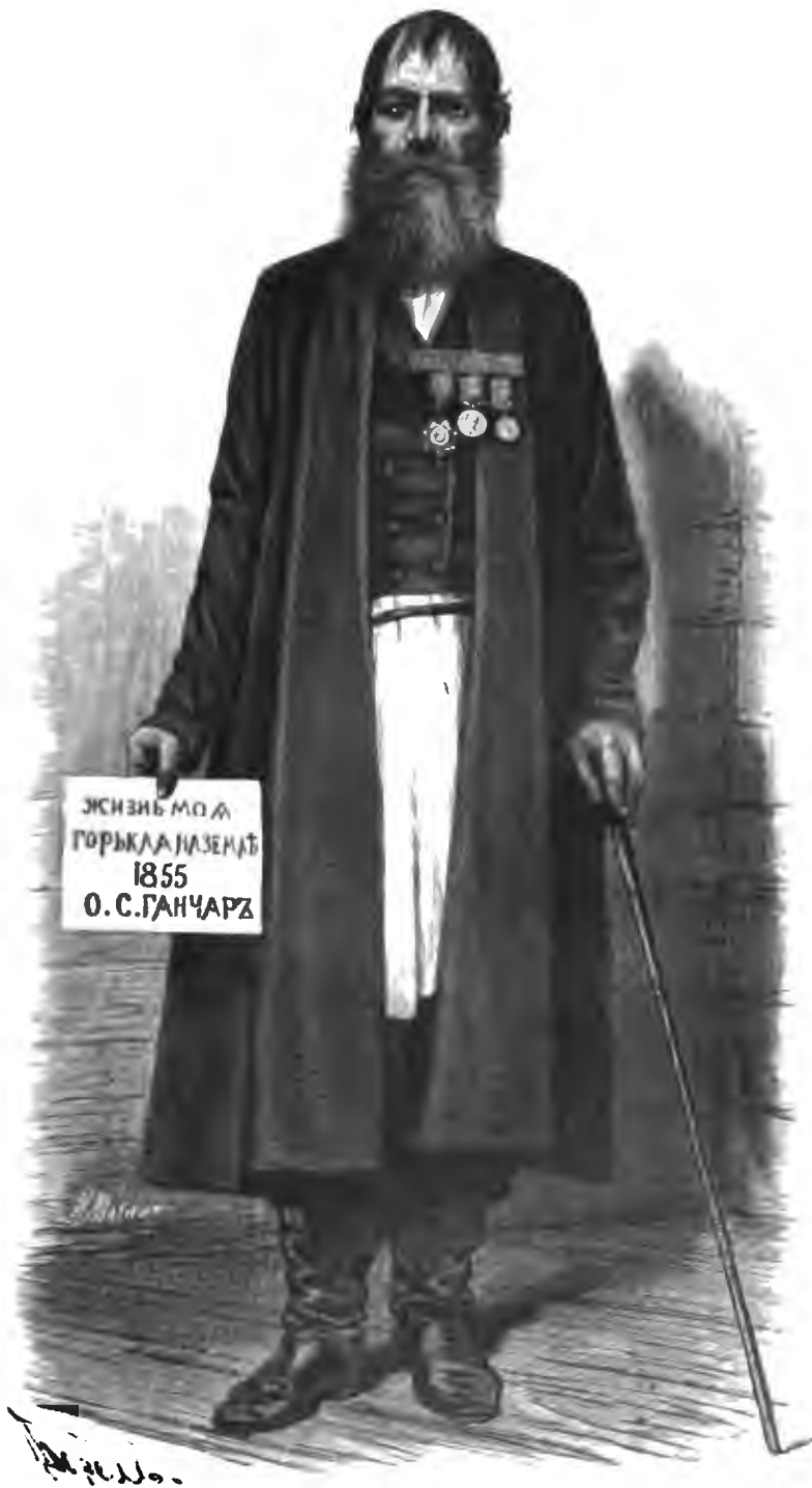
ОСИПЪ СЕМЕНОВИЧЪ ГАНЧАРЪ.